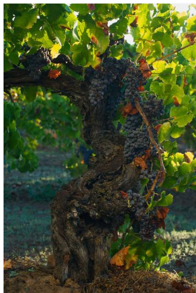
樹齢 101 年のグルナッシュ