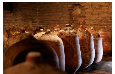
■Jarres (ジャー) 木樽と異なり、香りやタンニンがワインに移す事無く熟成が可能。

2018年ヴィンテージからは、ワインの熟成に「ジャー」と呼ぶ手作業で造られたテラコッタの甕を使用しています。この容器はワインの香りや味わいに影響を与える事のないニュートラルな素材の為、より純粋に果実とテロワールをワインに表現出来ると考えます。フレデリックは試行錯誤を繰り返した結果、現在は「粘土」と「砂岩」から造られた2種類のジャーを使用しています。低温で焼く「粘土」のジャーは通気性が高く、微量の空気置換により熟成が促されます。一方で「砂岩」のジャーは高温で焼く為に硬く空気の透過性が低くなります。熟成時にはこの二つのジャーを25%ずつ使用し、残りの50%を木樽で熟成させる事で、ワインの味わいのバランスをとっています。尚、木樽は1年使用後にDRCから購入した樽を、ブドウの状態に合わせて、6年程度まで使用しています。新樽はテロワールの要素をマスキングしてしまうと考えている為、使用していません。