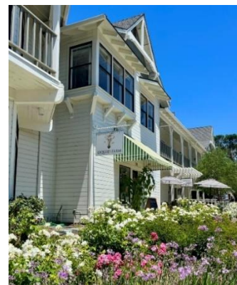
ロス・オリボスにある テイスティングルーム

二人の目標は、地上と地下で何が起きているのかを知ってもらい、その両方がワインと切っても切れない関係にあるということ伝えることです。ワインは結局のところ、大地と人間の手によって生み出されたもので、農作業からの液体だということ＝「It is Liquid from Farming」。その思いは、ロゴにも託しています。彼らが愛するタンポポに球根と色を付け、地下にあるものを地上へと運ぶ花（比喩的にブドウ）にしたデザインで、中央をかすかに走る線で“地上と地下”を表現しています。