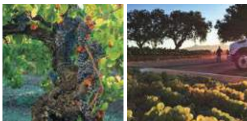
(左) 樹齢110年以上のグルナッシュ (右) マルヴァジアの畑 (下) 2018年に開設した念願のテイスティングルーム