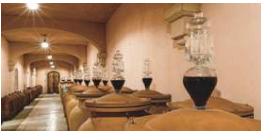
(左上) 醸造所外観 (右上) 醸造所に並ぶ木樽 (下) 一部のワインは、素焼きの甕を熟成に使用している