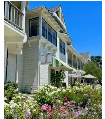
ロス・オリボスにある テイastingルーム

二人の目標は、地上と地下で何が起きているのかを知ってもらい、その両方がワインと切っても切れない関係にあるということ伝えることです。ワインは結局のところ、大地と人間の手によって生み出されたもので、農作業からの液体だということ＝「It is Liquid from Farming」。その思いは、ロゴにも託しています。彼らが愛するタンポポに球根と色を付け、地下にあるものを地上へと運ぶ花（比喩的にブドウ）にしたデザインで、中央をかすかに走る線で“地上と地下”を表現しています。